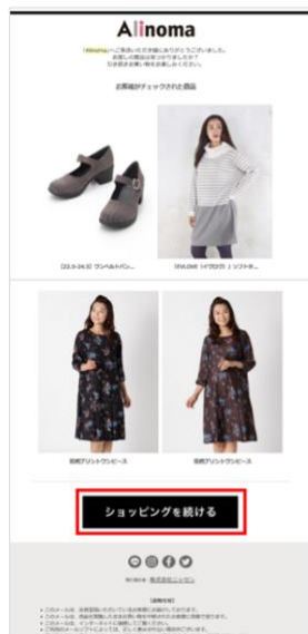
【NaviPlus リタゲメールイメージ】